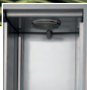
"Sistema a tamponi ribassati": + 8% capacità interna utile "Tamponi System": +8% more loading capacity