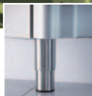
Piedini in acciaio inox regolabili in altezza (+60 mm) S/s feet with adjustable height (+60 mm)